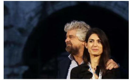
Un lungo post del leader del Movimento ribadisce l'appoggio alla sindaca di Roma

Presentatore solleva la maglietta dell'ospite